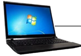
USB or Rs232c

距離計最大 5 台同時測定可能。 測定データを Excel に直接書き込み。 設定した間隔時間で自動測定。